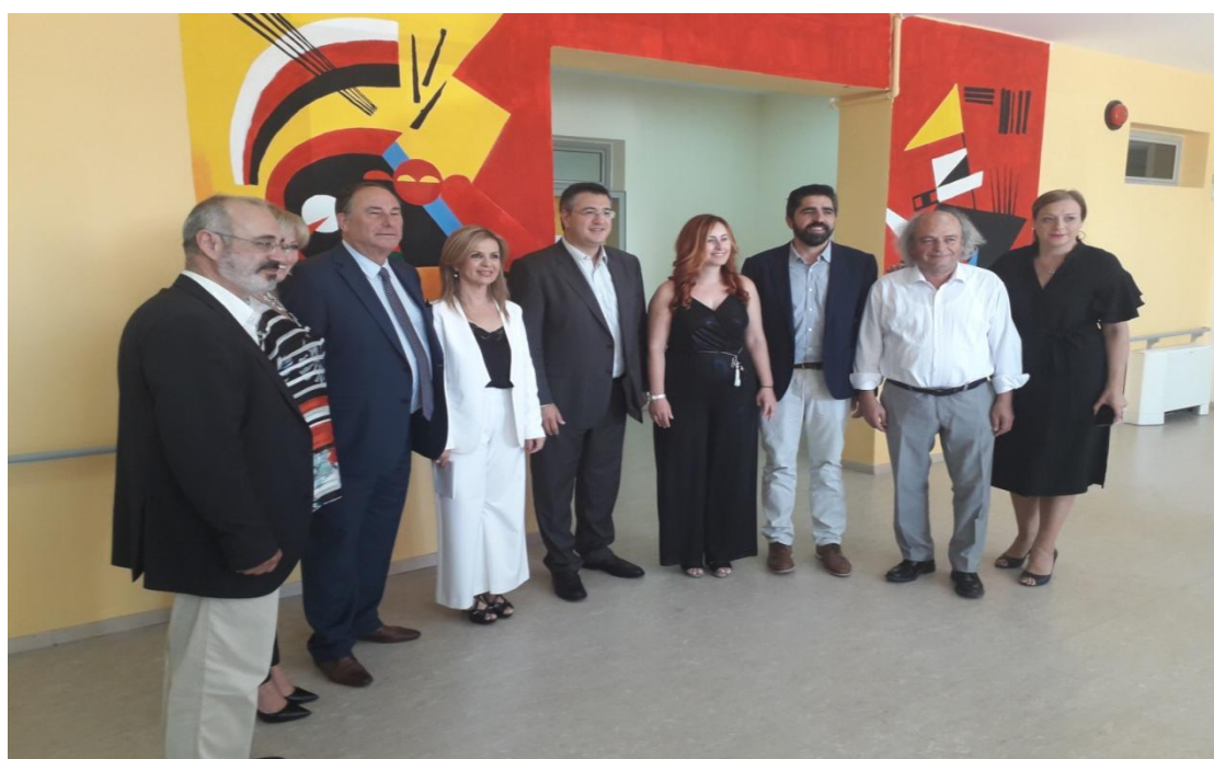
Γραφείο Τύπου Δήμου Χαλκηδόνος